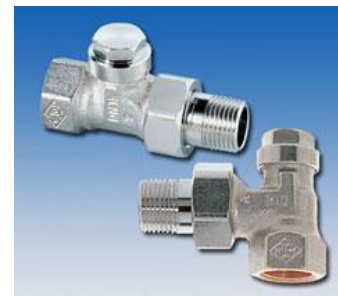
Regulax Radiator Lockshield