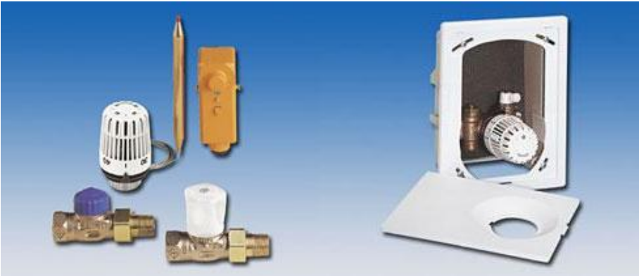
床暖房コントロールセット