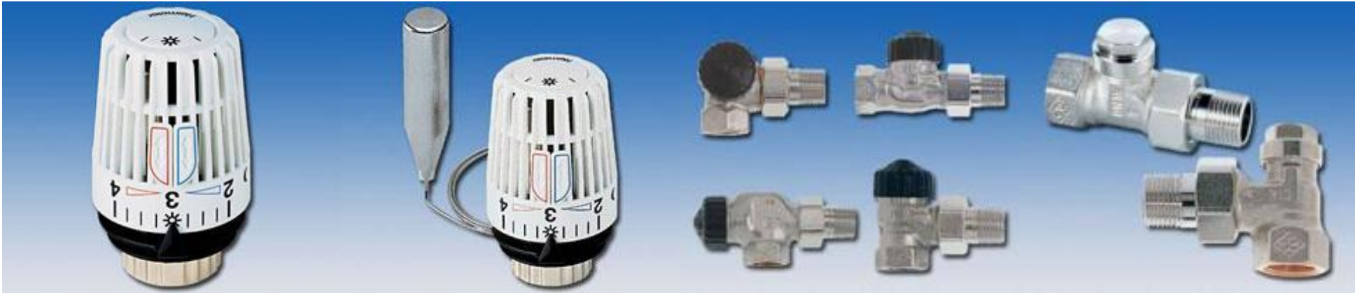
サーモヘッド（内部感温型）