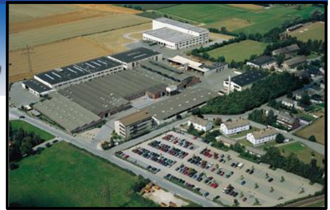
2008年 HEIMEIER Erwitte, Germany (アーウット、ドイツ)