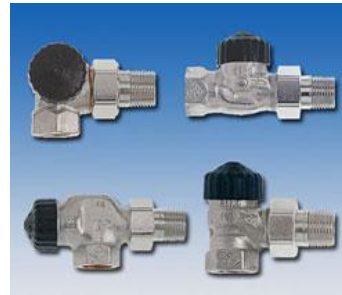
Thermostatic Valve Body