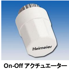
On-Off アクチュエーター