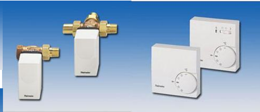
比例制御アクチュエーター