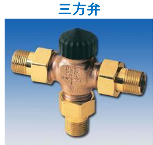
3-Way Reversing Valve