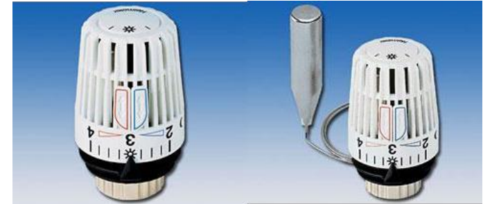
Thermostatic Head K 内部感温型